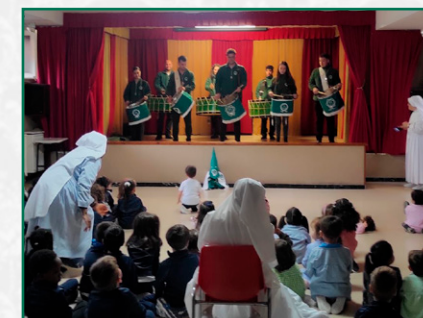
Presentación en la Inmaculada.