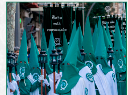
Jueves Santo, de verde y blanco.