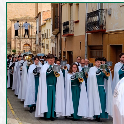
Domingo de Resurrección en Muriello de Río Leza.