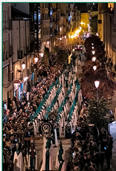
Calle Portales, Viernes Santo.

Ya en la llegada al cole se realiza el reparto de claveles a los cofrades.