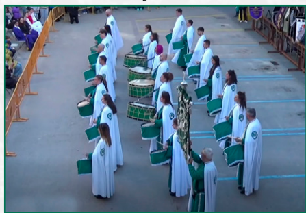
Exaltación en Mallén.