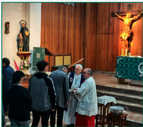
Miércoles de ceniza.

La Cuaresma, marcada por conciertos, certámenes y ensayos; y la Semana Santa, centrada en las grandes procesiones (Domingo de Ramos, Jueves Santo y la Magna del Viernes Santo), mostraron el compromiso organizativo y devocional de la cofradía. Durante la Cuaresma, la cofradía destacó por una agenda especialmente activa, orientada principalmente a la preparación musical y devocional de la Semana Santa.