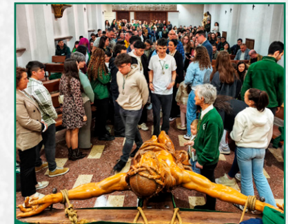
Besapias del Cristo.