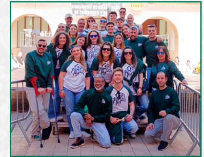
LPER en Híjar, Domingo de Ramos.

Ya por la tarde después de la celebración de los Oficios la procesión fue seguida con gran devoción. Dedicándonos otro año más una jota, esta vez a la salida del Colegio. Nuestra imagen titular, el Cristo de las Siete Palabras, volvió a ocupar un lugar central tanto por su fuerza estética como por la solemnidad del discurso procesional.