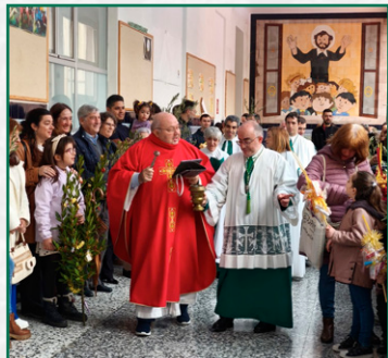
Bendición de ramos, Domingo de Ramos.

En la procesión de Lunes Santo las representaciones de nuestra cofradía pudieron portar diferentes atributos de la Cofradía de la Entrada de Jesús en Jerusalén y disfrutar de dicha procesión de Nuestro Padre Jesús Cautivo pasando el Puente de Piedra y su llegada a la Parroquia de San Antonio de Padua.