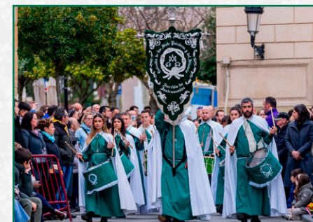
Exaltación 50 años banda del Nazareno.