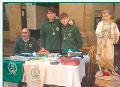
Jóvenes cofrades en el puestito, Viernes Santo.

Celebrados los Santos Oficios de la tarde desde la Junta de Hermandad nos aplazan la hora de salida de la Magna Procesión del Santo Entierro debido a la lluvia, nuestra cofradía fue en parte privilegiada ya que pudo disfrutar de dicha procesión durante toda la calle Portales pero cuando el Cristo llegó a la altura del Ateneo Riojano solo dio tiempo a ver la petalada a nuestro Titular, pero este año tuvo que realizarse con el plástico puesto debido a que tal era la lluvia que se tuvo que poner a mitad de calle Portales. Tras la suspensión, regresamos al colegio con paso rápido y ordenadamente.