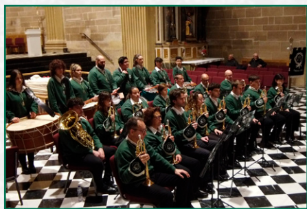
Concierto en Santo Domingo de la Calzada.