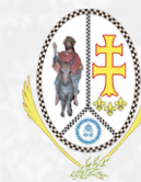
Cofradía de la Entrada de Jesús en Jerusalén (Jaca)

Revista de la Cofradía de las Siete Palabras y del Silencio de Logroño (Escolapios) Avda. Doce Ligero nº2 - 26004 Logroño (La Rioja)