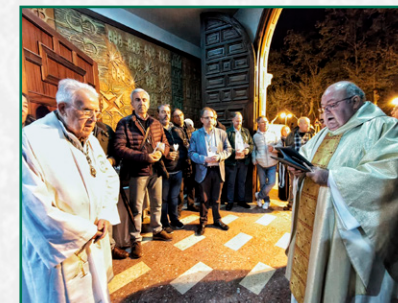
Vigilia Pascual en Escolapios.

Y para acabar llegamos al Domingo de Resurrección, asistimos a la procesión del Cristo Resucitado cuya imagen iba a realizar su última procesión ya que, en un principio, iba a ser sustituida para la Semana Santa del 2026. La sección de instrumentos asistió a la procesión en Muriello de Río Leza.