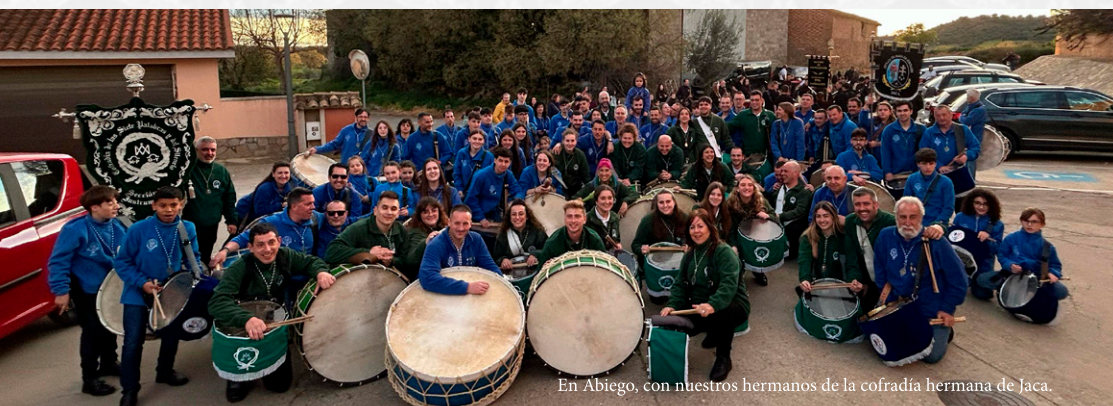
En Abiego, con nuestros hermanos de la cofradía hermana de Jaca.

Durante esta semana un grupo de cofrades realiza varias actividades explicando los atributos de la cofradía, taller de percusión