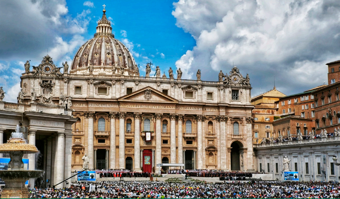
Inicio del Pontificado de León XIV