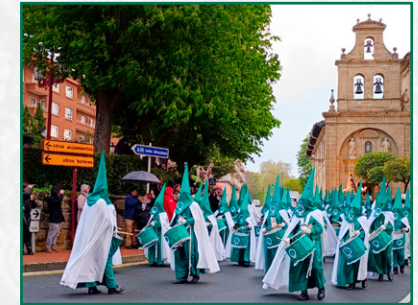
La banda de tambores y bombos en Haro.