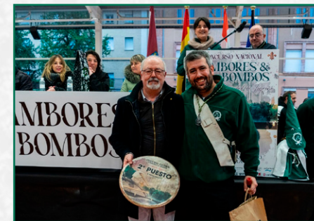
Recogiendo el segundo premio del concurso.