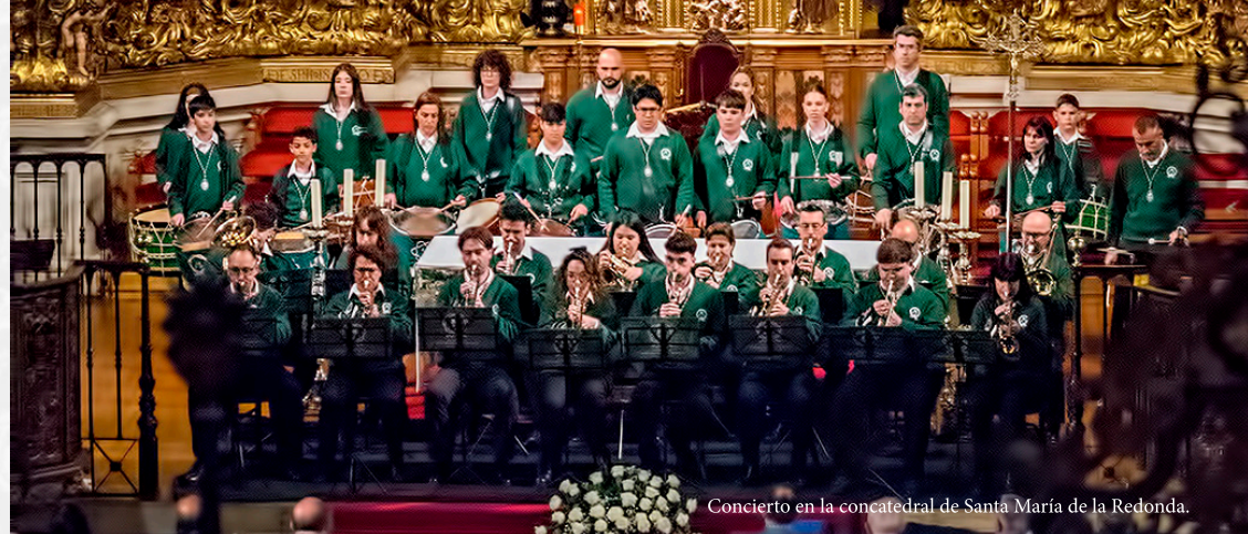
Concierto en la concatedral de Santa María de la Redonda.

y pintura en nuestro colegio de Escolapios con los alumnos más pequeños y mayores. También visitan la guardería de la Inmaculada realizando un par de toques para disfrute de los niños.