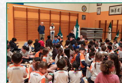
Presentación en Escolapios.