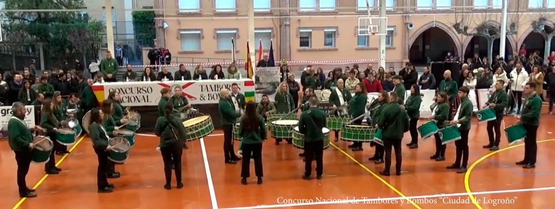
Concurso Nacional de Tambores y Bombos "Ciudad de Logroño"