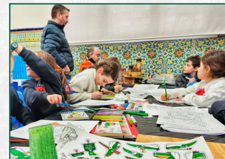
Taller de manualidades.