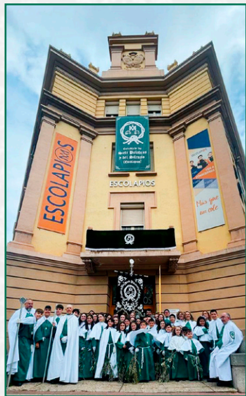
Nuestros infantiles, Domingo de Ramos.

Durante la tarde noche del Martes Santo, el Rosario del Dolor de la cofradía de la Santa Cruz (Hermanos Maristas) tuvo que ser suspendida por las inclemencias meteorológicas celebrándose un emotivo acto en la Iglesia de San Bartolomé y la Flagelación de Jesús desde la iglesia de Santa Teresita tuvo que resguardarse de la lluvia en mitad de procesión.