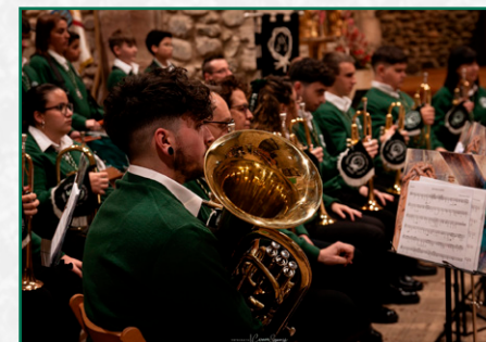
Concierto en Santurde de Rioja.