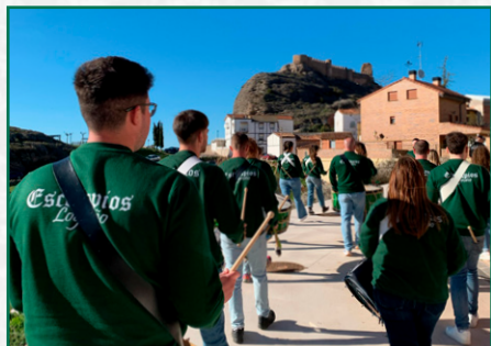
Exaltación en Clavijo.

Empezando con la tercera semana de Cuaresma el viernes se asiste a la celebración del Viacrucis en la Iglesia de nuestra Señora de Valvanera, este mismo día la banda del paso llega a Santo Domingo de la Calzada para ofrecer un concierto en el Convento de San Francisco y al día siguiente el grupo de exaltación de Tambores y Bombos participa en la exaltación del 50º aniversario de la Banda de Tambores de la Cofradía Jesús Nazareno y Nuestra Señora de los Dolores en la plaza de San Bartolomé.